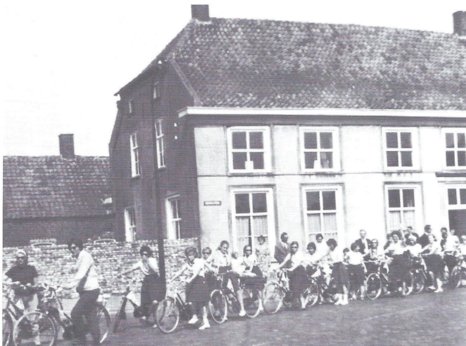
Het Katholieke Meisjes Gilde voor de oude pastorie op het Heuvelplein staat gereed voor een fietstocht.

was groot. Het democratisch denken bracht allerlei initiatieven naar voren. Veel vrijwilligers zetten hun schouders onder het parochiewerk. Jongeren- en kinderkoren ontstonden, gezinsvieringen werden gehouden, gespreksgroepen ontstonden,